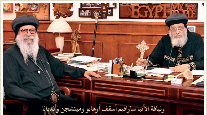
ونيافة الأنبا سارافيم أسقف أوهايو وميتشجن وأنديانا