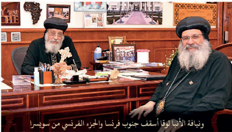
ونيافة الأنبا لوقا أسقف جنوب فرنسا والجزء الفرنسي من سويسرا