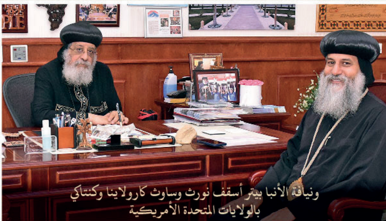
ونيافة الأنبا بيتر أسقف نورث وساوث كارولينا وكنتاكي بالولايات المتحدة الأمريكية