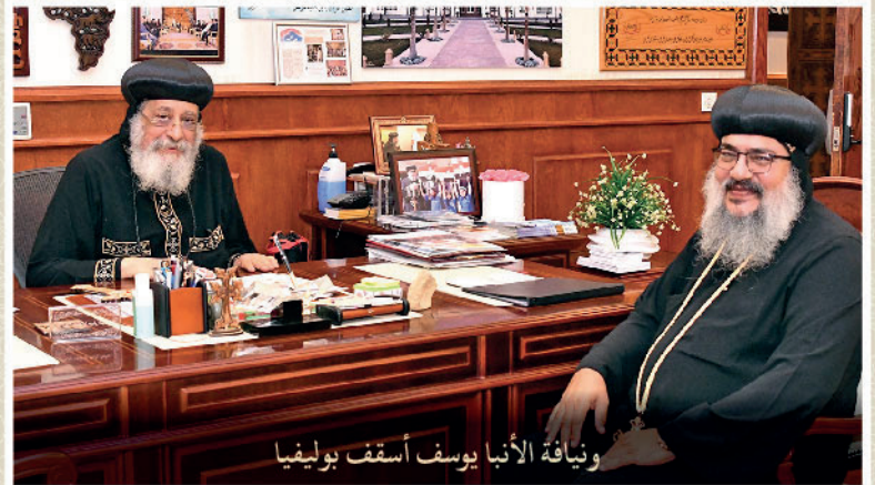
ونيافة الأنبا يوسف أسقف بوليفيا