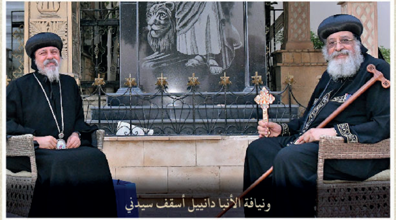
ونيافة الأنبا دانييل أسقف سيدني