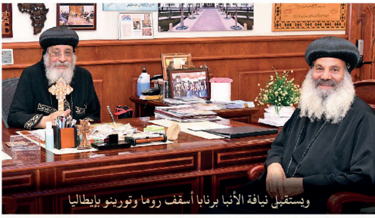
ويستقبل نيافة الأنبا برنابا أسقف روما وتورينو بإيطاليا