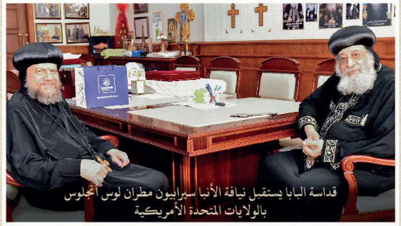
قداسة البابا يستقبل نيافة الأنبا سيرابيون مطران لوس أنجلوس بالولايات المتحدة الأمريكية