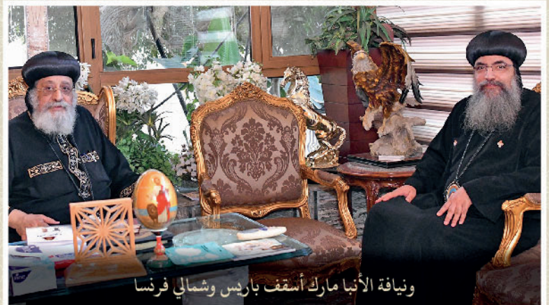
ونيافة الأنبا مارك أسقف باريس وشمال فرنسا