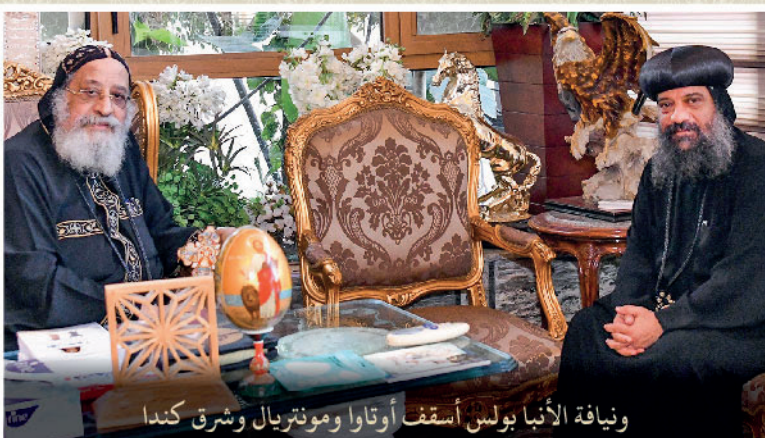
ونيافة الأنبا بولس أسقف أوتاوا ومونتريال وشرق كندا