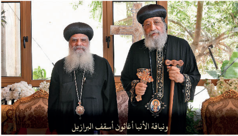
ونيافة الأنبا أغاثون أسقف البرازيل